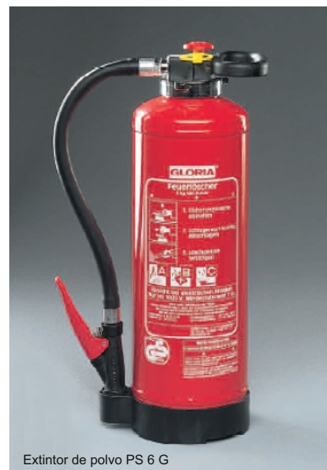
Extintor de polvo PS 6 G